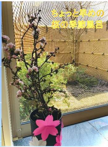
ちょっと早めの 桜の季節風色