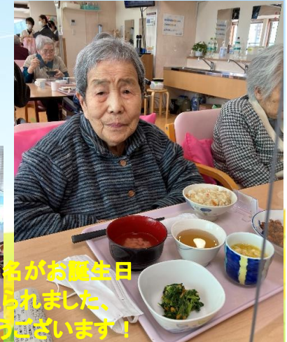
今月は9名がお誕生日 を迎えられました、 おめでとうございます！

※ 受け入れ状況を曜日の前に入れていきます。 ※ 受け入れ状況は変動がございます。調整可能な場合もございますので、是非ご相談ください。