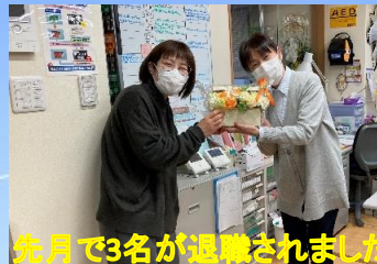
先月で3名が退職されました お疲れ様でした