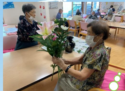
レクリエーションと創作活動中・・・皆さん集中されています♪

日々の何気ない活動の一部を掲載させていただきます♪コロナ禍で活動の幅が制限されている中ではありますが、毎日が充実したものとなりますよう活動へ取り組んでいただいております。