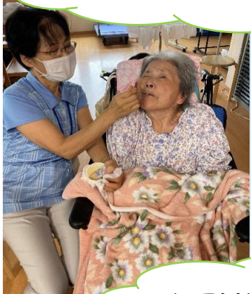
とってもおいしくいただきました♪