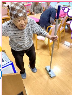
月に1回大掃除の様子♪