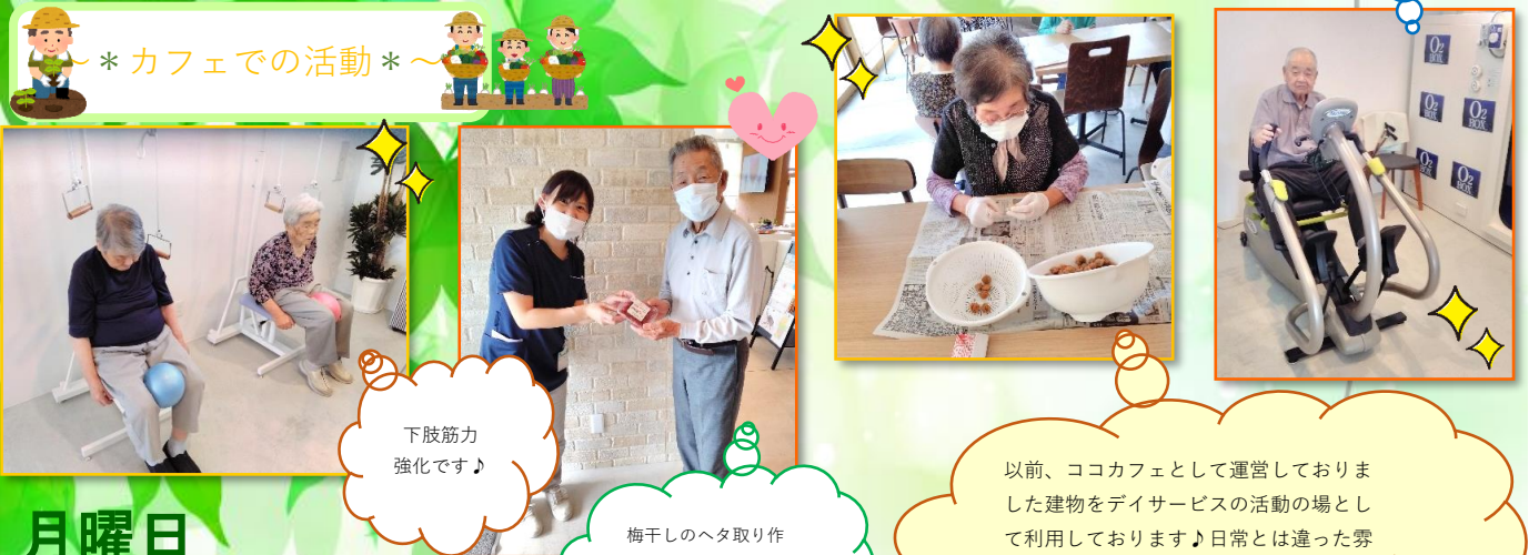
下肢筋力強化です♪