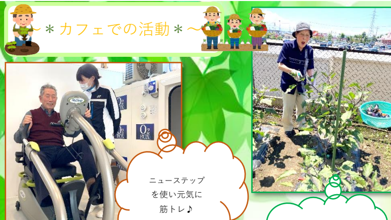
* カフェでの活動 *